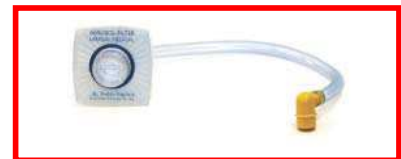
FILTRO 781200 unidad

Puede adquirir un Kit de conversión LSU, que actualiza su LSU antiguo a la versión actual. Ref. 78090029