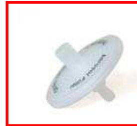
FILTRO 781004 paq. de 12 FILTRO 781005 paq. de 50

No tiene etiqueta informativa de la correcta colocación de las conexiones