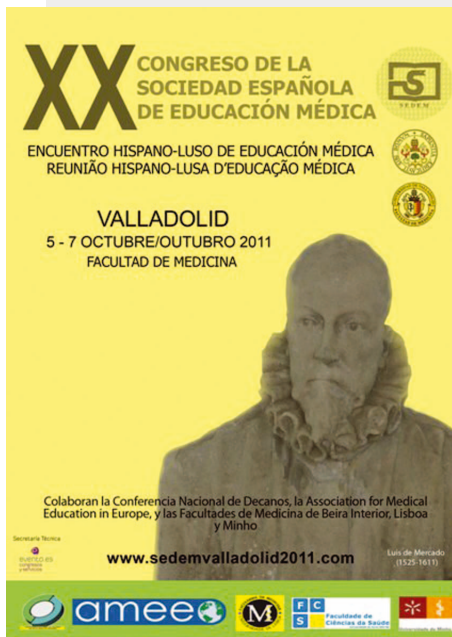
XX Congreso de la Sociedad Española de Educación Médica (SEDEM) Valladolid, 5-7 de octubre de 2011